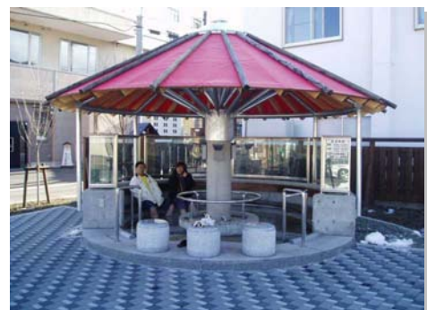
賑わう足湯ポケットパーク