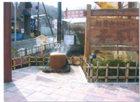
気軽に立ち寄れる手湯