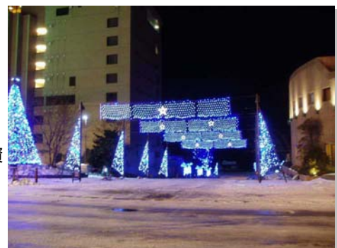
イルミネーションストリートの様子